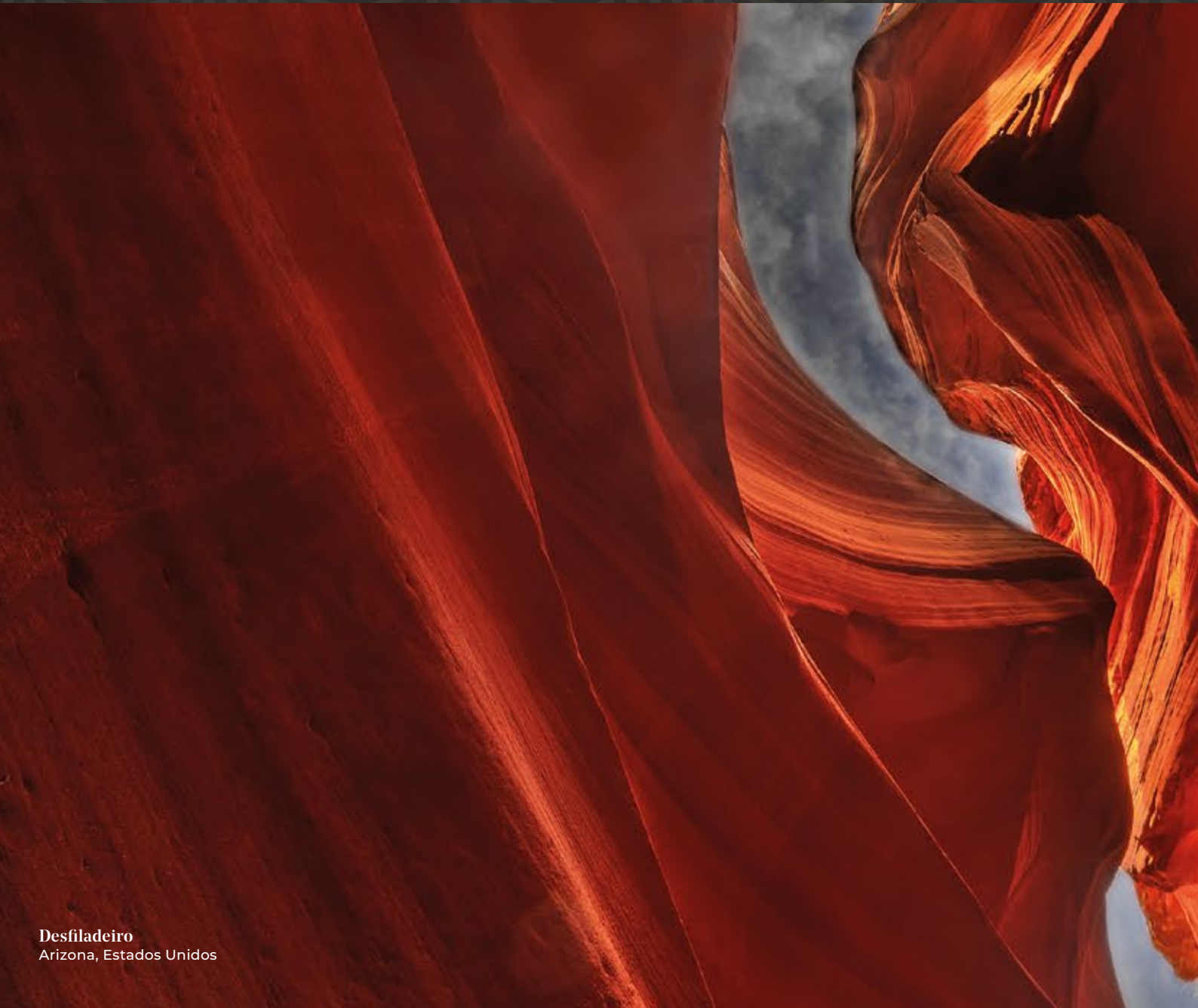
Desfiladeiro Arizona, Estados Unidos