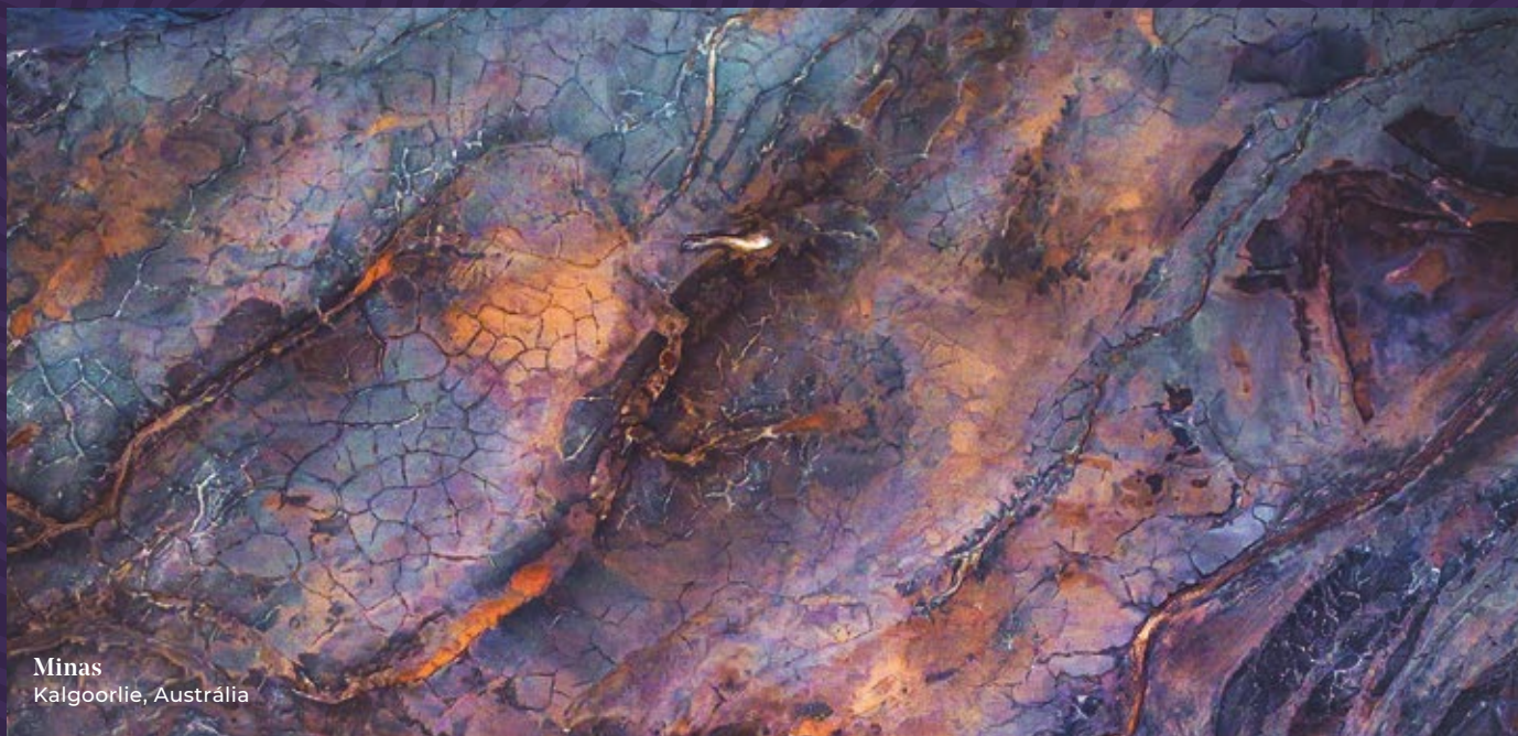
Minas Kalgoorlie, Austrália