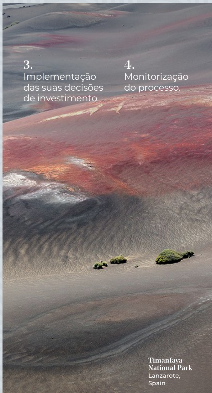
Timanfaya National Park Lanzarote, Spain